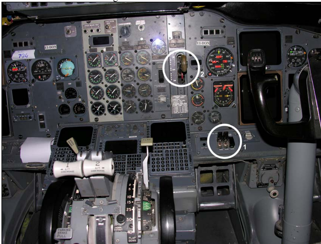
Рис. 2. Кабина экипажа самолета Boeing-737-300 EI-DON после посадки с невыпущенными стойками шасси 01.10.2008г. Тумблеры FLAP INHIBIT и GEAR INHIBIT – деактивированы, TERRAIN INHIBIT – активирован (1), рычаг уборки/выпуска шасси в положении OFF – шасси убрано (2).