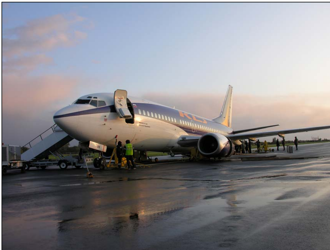
Рис. 1. Общий вид места авиационного происшествия с самолетом Boeing-737-300 EI-DON 01.10.2008г.